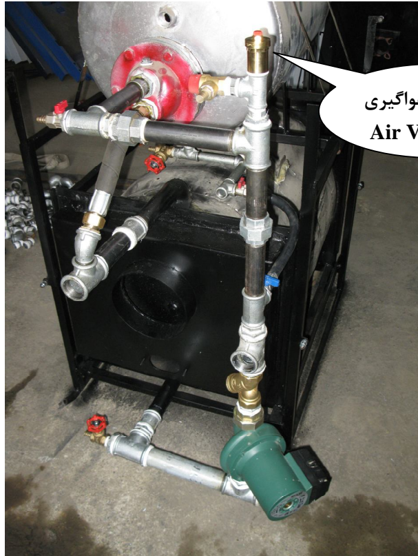
شیر هواگیری خمدکا، Air Vent

پس از اطمینان از پر بودن سیستم ، نسبت به هواگیری رادیاتورها اقدام نمائید . جهت اطمینان از هواگیری بهتر است پمپ روشن و حداقل 10 دقیقه آب در سیستم مدار بسته در چرخش باشد . پس از هواگیری رادیاتورها فشار سیستم کاهش خواهد یافت . حالا می بایست مجدداً دستورالعمل هفت گانه فوق را تکرار نمائید .